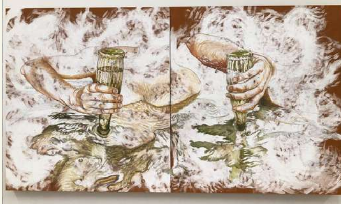
Chloé Silbano, Sans titre, huile sur toile, 100x180cm, 2024

Quant à la relation des chinois avec la peinture contemporaine je dirais qu'elle est figurative et décroisée.