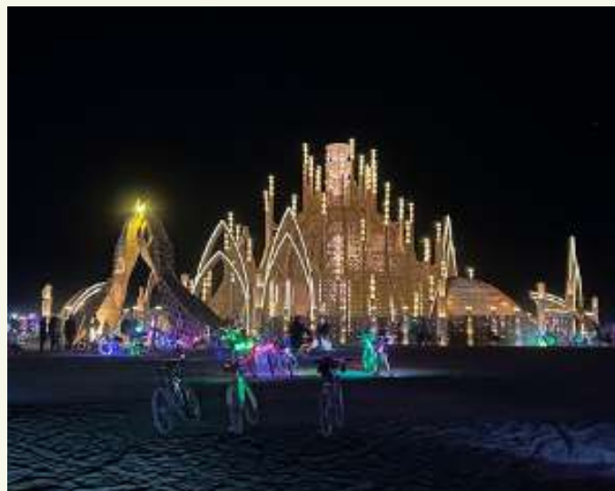
Temple of Together by Caroline Ghosn (Oakland)

De formation et expériences professionnelles généralement différentes des artistes, je mets à disposition des outils ou techniques pour accompagner l'artiste mentorée au fur et à mesure de l'avancée de ses réflexions. Savoir être curieux, porter un regard critique mais toujours en bienveillance, nourrir constamment une ouverture d'esprit et pouvoir aider à mon échelle sont des éléments fondateurs pour moi.